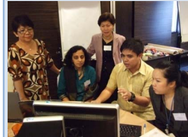
Participantes à des ateliers récents